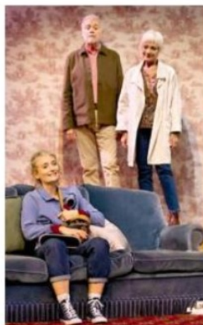
Chers Parents Jusqu'au 27 fév., au Théâtre de Paris.